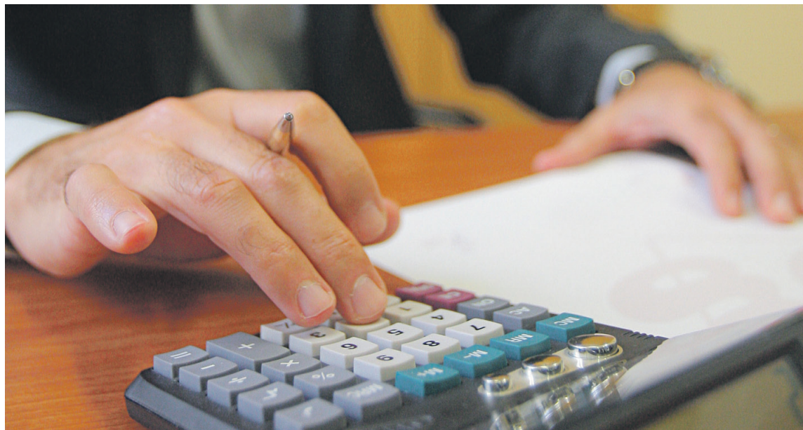
Las empresas deben establecer protocolos para evitar la comisión de irregularidades incluso penales.

A nivel de contenido de los Programas de Compliance, el artículo 31 bis del Código Penal nos indica que se deberán identificar las actividades en cuyo ámbito puedan ser cometidos los delitos mediante la confección de un mapa de riesgos penales, así como la implantación de protocolos y procedimientos que garanticen la correcta adopción de decisiones y ejecución de las mismas en la empresa. A nivel de recursos financieros se deberá disponer de modelos de gestión adecuados para impedir la comisión de delitos, y finalmente la compañía también deberá implantar un sistema disciplinario que sancione adecuadamente el incumplimiento del modelo de cumplimiento corporativo. Junto con todo lo anterior, se deberá crear en la empresa la figura del denominado Compliance Officer, es decir, la